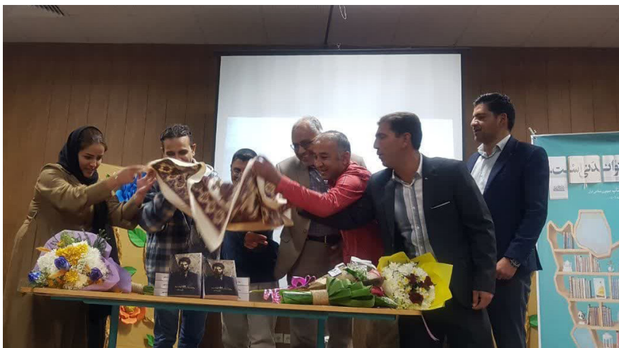
رونمایی کتاب به چشمانت مومن شدم

باشد که روزی در عرصه نویسندگی، این حرفه و هنر زیبا، حرفی برای گفتن داشته باشم.